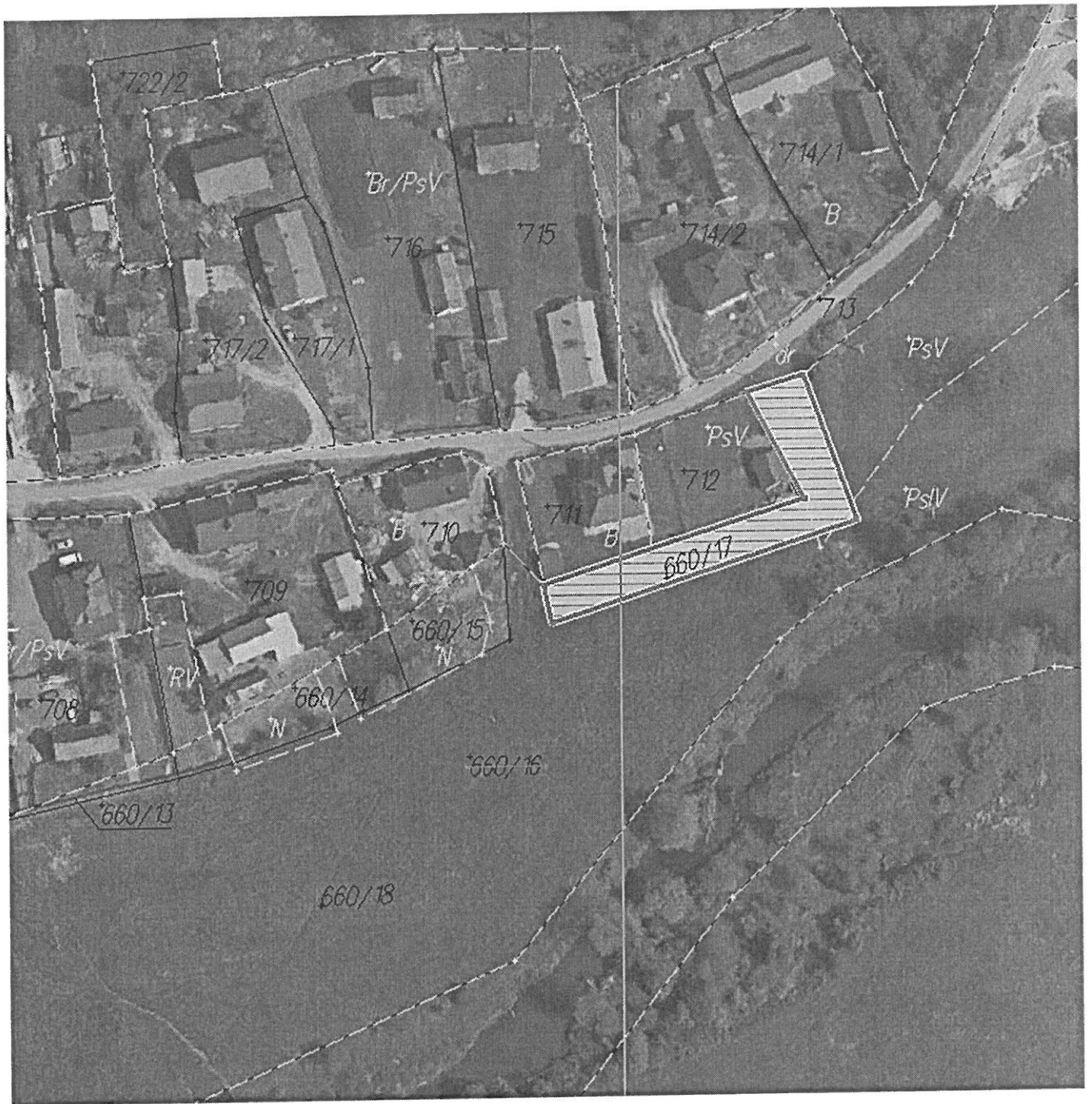
Nowa Grobla dz. 660/17